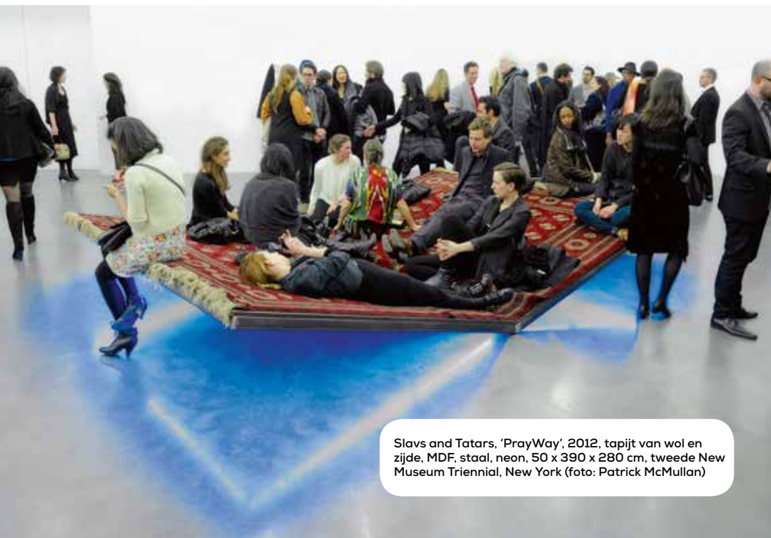
Slavs and Tatars, 'PrayWay', 2012, tapijt van wol en zijde, MDF, staal, neon, 50 x 390 x 280 cm, tweede New Museum Triennial, New York

De eerste vijf edities (1949, 1952, 1955, 1958, 1966) toonden een overzicht van de moderne beeldhouwkunst. Niet zelden deden wel tachtig kunstenaars mee met zo'n driehonderd sculpturen. Sonsbeek 1, 2 en 3 waren een immens succes, daarna kreeg het concurrentie van soortgelijke tentoonstellingen. Vanaf Sonsbeek 6 werd het roer omgegooid. Er werd gewerkt met organisatoren die concepten ontwikkelden en de deur openden voor een breder scala aan kunst. De tentoonstellingslocatie beperkte zich niet langer tot het park. De beroemdste editie, 'Sonsbeek buiten de perken', in 1971 door Wim Beeren georganiseerd, besloeg zelfs heel Nederland. Met