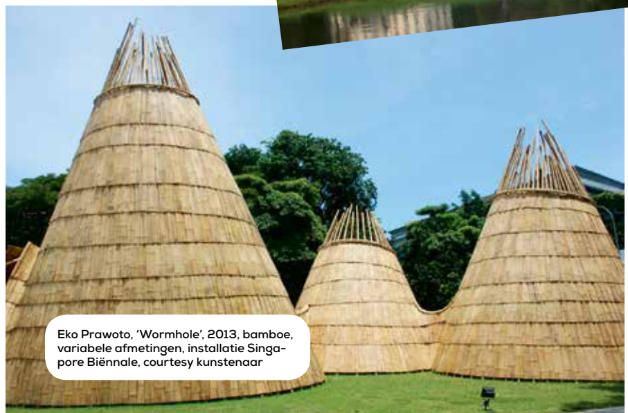
Eko Prawoto, 'Wormhole', 2013, bamboe, variabele afmetingen, installatie Singapore Biënnale, courtesy kunstenaar