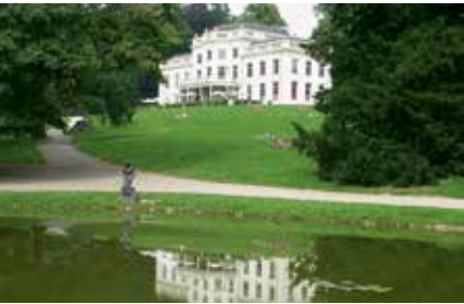
Park en huis Sonsbeek, Arnhem

Op uitnodiging van het Indonesische collectief ruangrupa strijken deze zomer zo'n veertig kunstenaars neer in Arnhem, onder wie veel Aziatische. Sonsbeek 2016 draait om vriendschap, politiek en de kracht van het individu.