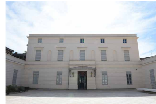
Hôtel Montcalm, open in 2019

naars, de kwaliteit van de kunstwerken en de tentoonstellingsinrichting. Het is net als Retour sur Mulholland Drive een tentoonstelling voor fijnproevers. De kunstenaarsselectie is breed: Frans en internationaal, jong, mid-career en gevestigd. Vooralsnog overheersen kunstenaars uit de Verenigde Staten en Europa, maar misschien is het een kwestie van warmdraaien. Najaar 2018 staat een retrospectief rond de Zuid-Koreaanse Haegue Yang gepland en in oktober is onder meer een solo van de Belgische kunstenaar Jacques Charlier te zien. Opvallend is de keuze voor de Duitse kunstenaar John Bock. Na zijn deelname aan documenta11 (2002) struikelde je in