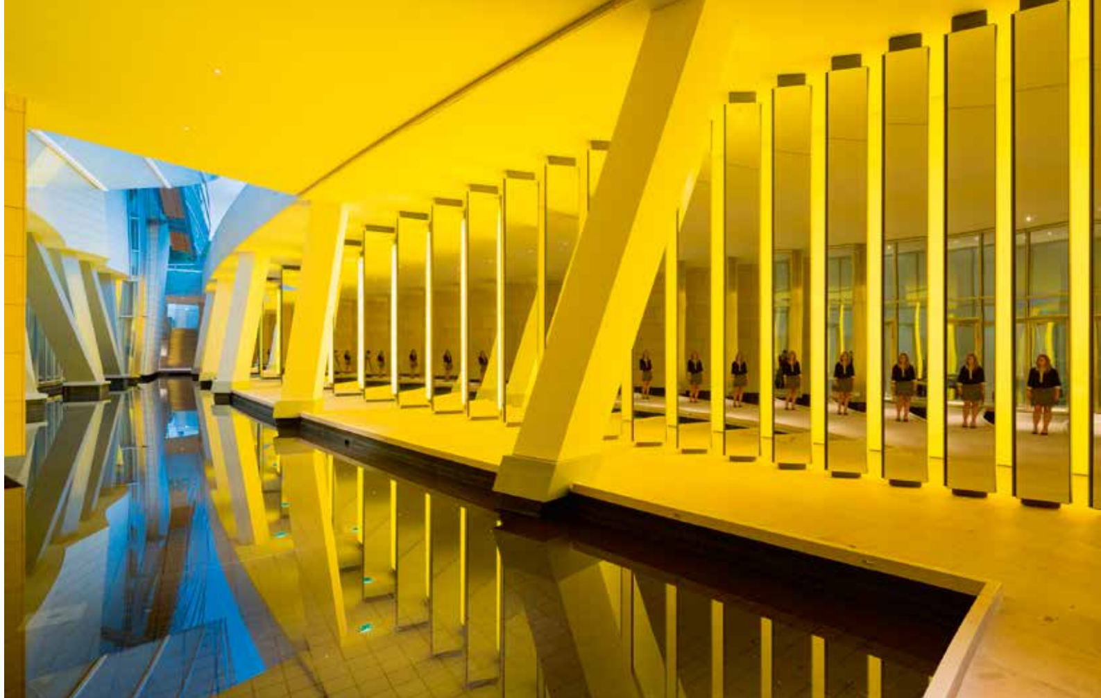
Olafur Eliasson, 'Inside the Horizon', 2014, 43 prismavormige pilaren van verschillende breedtes, geplaatst rond het waterbassin in de 'Grotto'