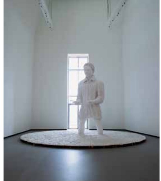
Thomas Schütte, 'Mann im Matsch', 2009, piepschuim, gips en hout, 580 x 850 x 850 cm

Waar Arnaults collectie uit bestond was lange tijd niet bekend, en dat geheim werd beter bewaakt dan de Engelse kroonjuwelen.