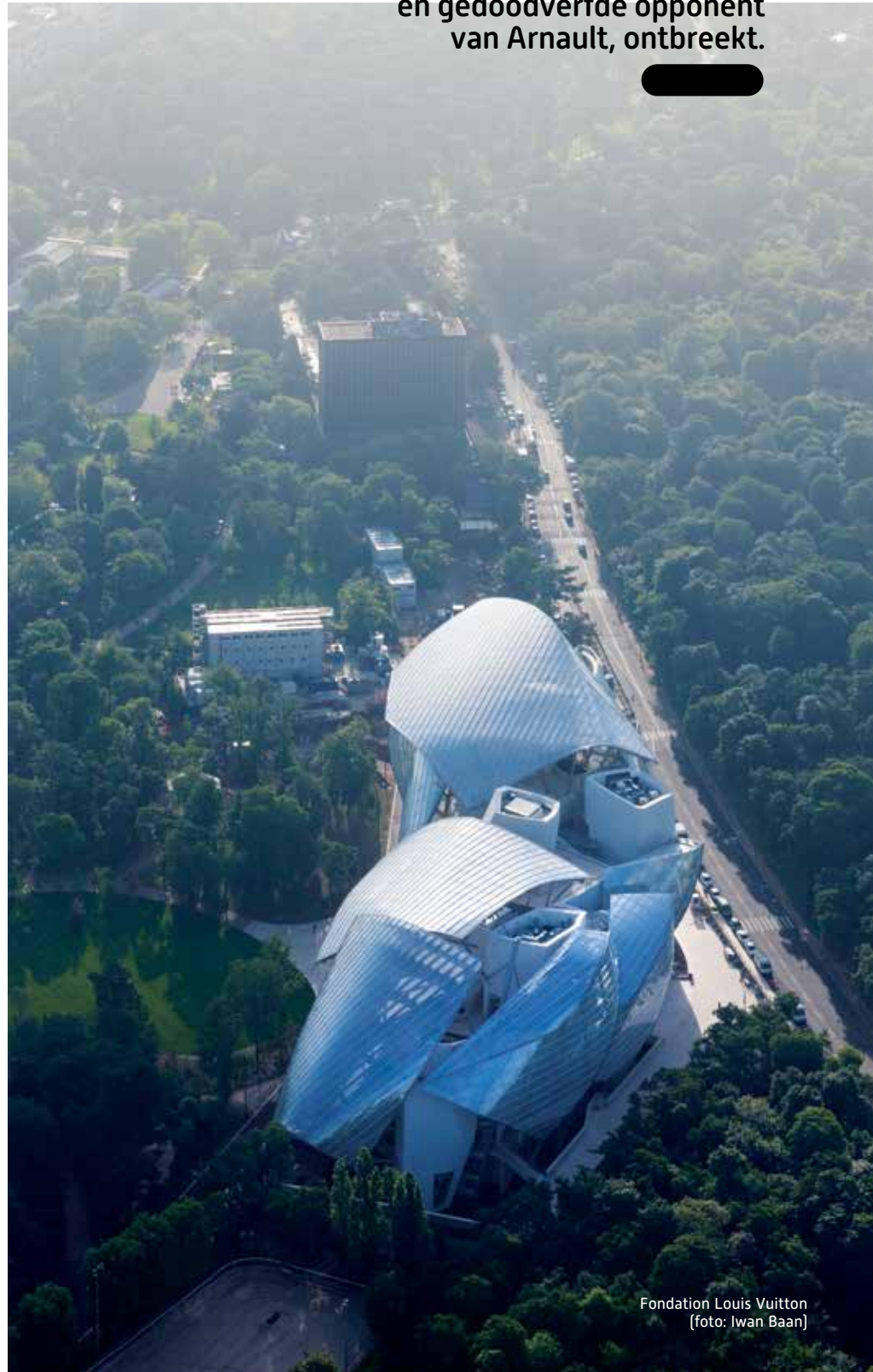
Fondation Louis Vuitton