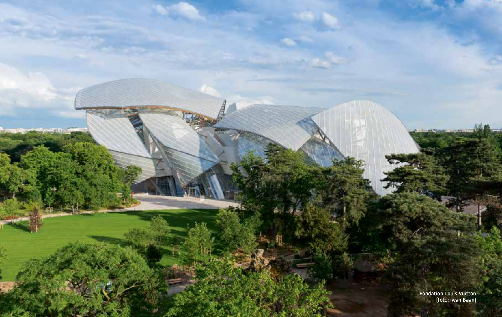
Fondation Louis Vuitton