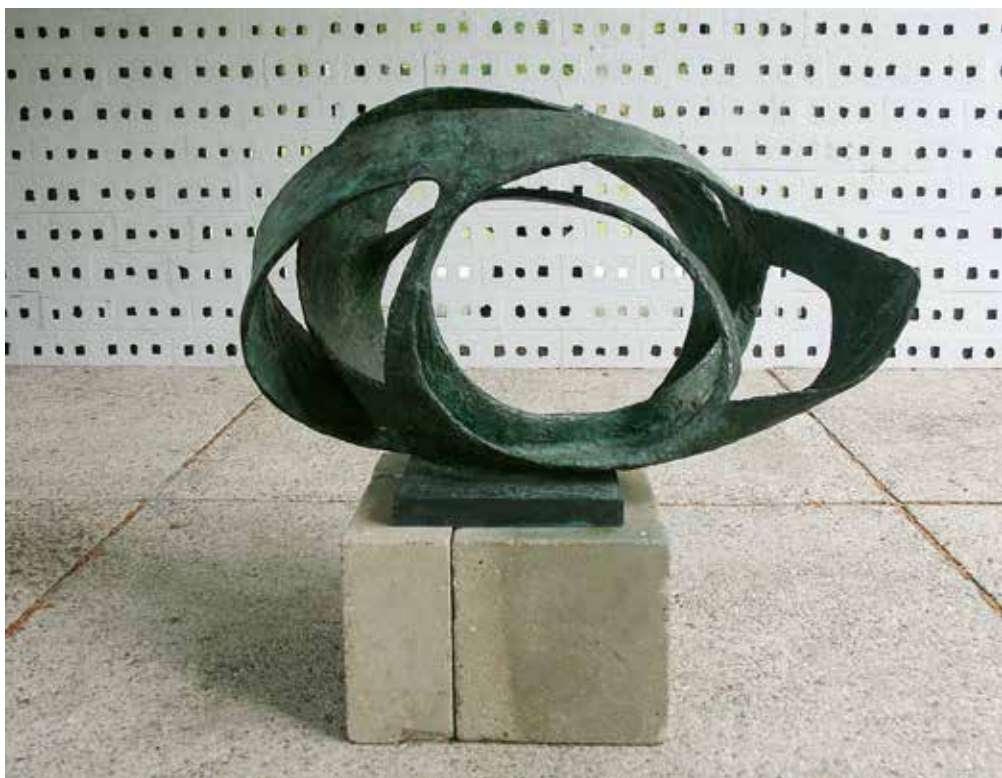
‘Oval form (Trezion)’, 1961-63, brons, 94 x 144 x 87 cm, Aberdeen Art Gallery and Museums Collections, tentoongesteld in het Rietveldpaviljoen, Otterlo

‘Barbara Hepworth: Sculpture for a Modern World’, 28 november t/m 17 april, Kröller-Müller Museum, Houtkampweg 6, Otterlo; di t/m zo 10-17; MK € 8,80; catalogus (€) € 34,95 (Tate Gallery); kmm.nl