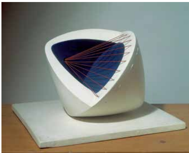
‘Sculpture with colour (Deep Blue and Red) (6)’, 1943, gips en draad op een gipsen sokkel, 10,5 x 14,9 x 10,5 cm, St Ives, Barbara Hepworth Museum (© Bowness)