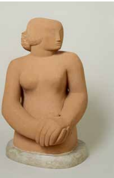
'Figure of a woman', 1929-30, Corsehillsteen op marmeren basis, 53,3 x 30,5 x 27,9 cm, St. Ives, Barbara Hepworth Museum [© Bowness/Hepworth Estate]

In 1931 maakte Barbara Hepworth haar eerste doorboorde vorm. Het zou een van haar handelsmerken worden. Haar versie van 'truth to material' betekende ook dat ruimte, net als massa, deel is van de sculptuur en zelfs als een materiaal te beschouwen is. Door ruimte te omgeven met vorm, wordt het onzichtbare zichtbaar gemaakt. Het citaat hierboven uit 1950 komt van Bram Hamacher, directeur van het Kröller-Müller Museum.