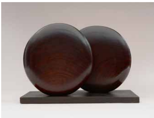
‘Discs in Echelon’, 1935, padouk hout, 31,1 x 49,1 x 22,5 cm, New York, Museum of Modern Art (© Bowness)