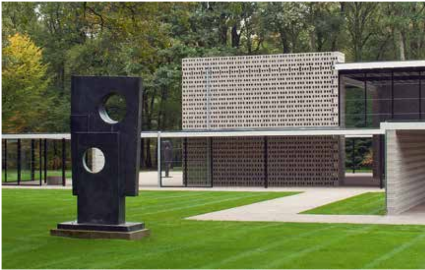
Gerrit Rietveldpaviljoen met 'Squares with two circles', 1963-64, brons, 317 x 157 x 76,5 cm, Otterlo, Kröller-Müller Museum

Moore, met wie ze voortdurend vergeleken werd en een gezonde rivaliteit onderhield, maakten hun beelden direct in steen of hout. Ze verzetten zich tegen de mechanische bronzen pracht en praal van de Victoriaanse sculptuur. Hun werk was rauwer en directer. Hepworth en Moore herintroduceerden met andere woorden het ambacht in de kunst. Hepworth kende de mogelijkheden en eigenschappen van steen of hout door en door. Ze zag direct wat je er wel of niet mee kon. De kunst was om de essentiële vorm, de kwaliteit van de kleur en het oppervlak te benadrukken en zo de steen of het stuk hout leven in te blazen.